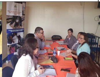
G Focal R Central