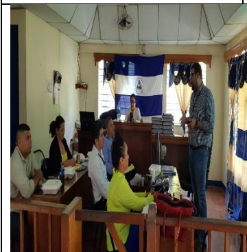
Siuna - Formación