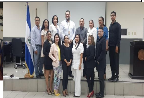
Managua I y II Formación