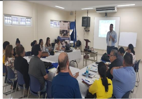
Estelí, jornada de formación Dia 2