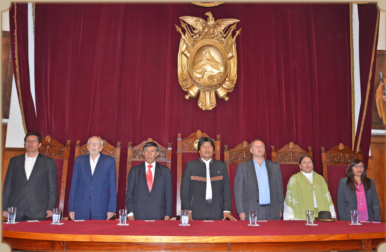
Autoridades de los Órganos Ejecutivo, Judicial y Legislativo durante el acto oficial de puesta en vigencia del Código Procesal Civil y Código de las Familias y Proceso Familiar, realizó el 10 de febrero del 2016.