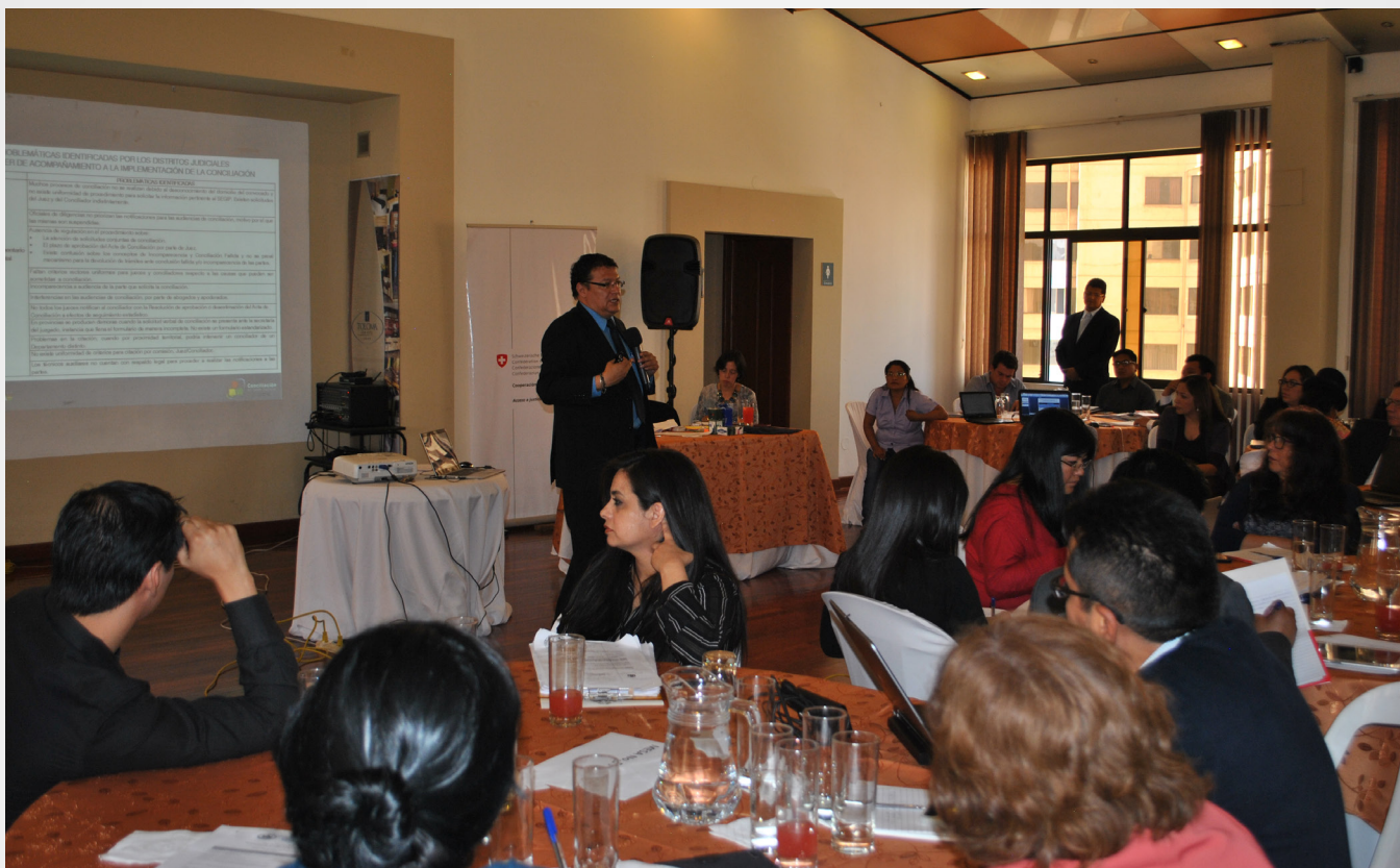
Segunda reunión de evaluación de la implementación de la conciliación en sede judicial a cargo del Comité Técnico de Seguimiento, septiembre de 2016 en Cochabamba